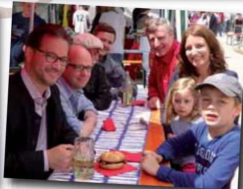
2016 war Florian Pronold Schirmherr unseres Europafestes